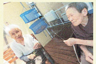
*梅を収穫・・・おしゃべりに花が咲きます・・・