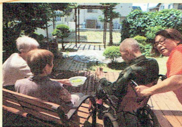
テラスに出て日向ぼっこ