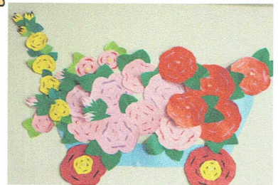
* 折り紙で薔薇の花を作りました

* 全国で移動自粛の全面解除がされましたが「気の緩み」なく感染防止対策は続けて行きたいと思います。