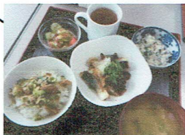
揚げサバのおろしがけ やたら