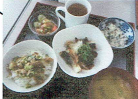
揚げサバのおろしがけ やたら