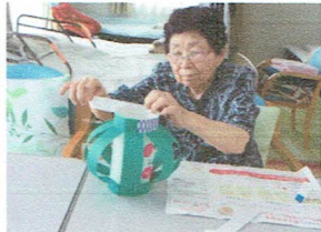
準備も皆で頑張りました