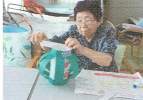
準備も皆で頑張りました