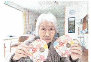
はまぐり合わせで皆様素晴らしい記憶力！