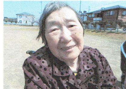
咲き始めもキレイよ♡