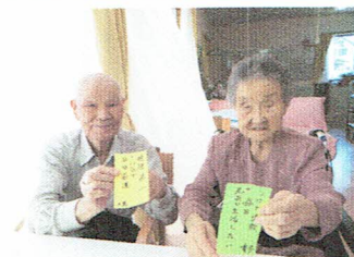
～短冊に願いを込めて～