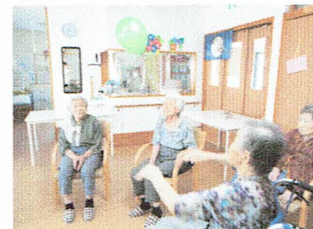
～風船バレーで 心も身体もリフレッシュ～