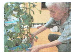
～ミニトマト収穫祭～